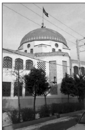
۴. مسجد حضرت قمر بنی هاشم علیه السلام