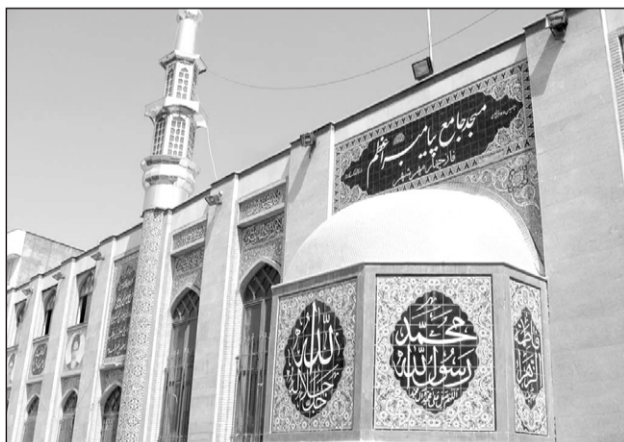
۳. مسجد جامع پیامبر اعظم صلی الله علیه و آله