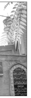
۲. مسجد ابوذر