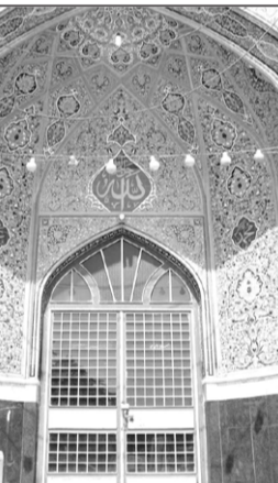
۱. مسجد المهدی عجل الله فرجه