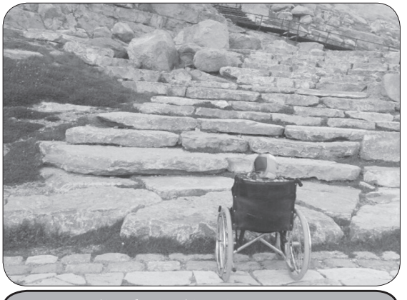
عدم مناسب سازی امکان جاذبه‌های گردشگری استان

ماشین دنبال یک دوربرگردان یا چهارراه برای رد شدن از خیابان باشند.در سطح شهر دستشویی‌های فرنگی یا اصلا وجود ندارد و یا اینکه قفل شده است و امکان استفاده از آنها نیست. حتی سرویس بهداشتی عمومی برای افراد معمولی هم خیلی کم است. پارکها نیز اصلا مناسب سازی نشده‌اند، اندازه سرویس بهداشتی پارک «شرقی» برای یک ویلچر کوچک است، درب سرویس فرنگی پارک «شاهد» قفل است، حتی رمپ آن قابل استفاده نیست، مسیر نایبایان پارک «زرین» تنها پارک مناسب سازی شده است که تیر چراغ برق ختم می‌شود. در هیچکدام از پارک‌های کرمانشاه وسایل