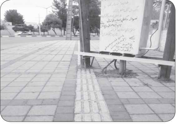
مسیر نایبایان که تیر چراغ برق ختم میشود

کیانی با اشاره به مناسب سازی مراکز گردشگری و تفریحی استان کرمانشاه، افزود: صدور مجوز ۱۵ مرکز گردشگری، بوم گردی، تفریحی، تاریخی، اقامتی و... بر عهده اداره کل میراث فرهنگی استان است که می‌تواند صدور مجوز این مراکز را مشروط به اجرای قوانین مناسب سازی کند و زمینه دسترسی همافکنی و پیگیری مناسب سازی استان کرمانشاه بهسازی و مناسب سازی‌های انجام شده در برخی از معابر سطح شهر کرمانشاه را غیر اصولی دانست و گفت: حتی یک پل عابر پیاده برای تردد معلولان در این شهر وجود ندارد، وی همچنین به وضعیت ناوگان حمل و نقل عمومی استان کرمانشاه اشاره و تأکید کرد: یکی از دغدغه‌های اساسی معلولان مناسب سازی سیستم حمل و نقل عمومی است که همواره در این زمینه