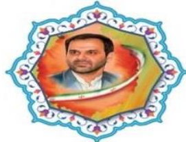
طرح شهید کاظمی آشتیانی