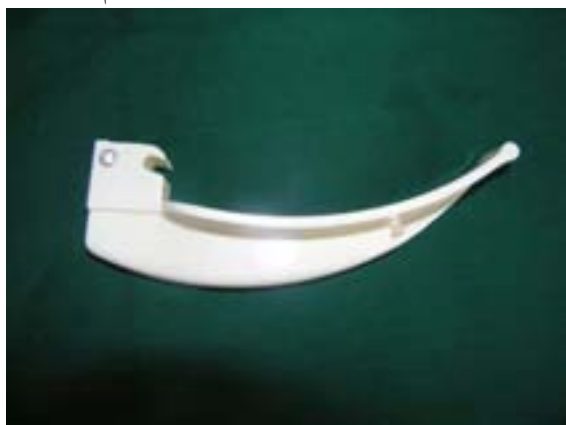
شکل ۱. تیغه‌ی لارنگوسکوپ یکبار مصرف مکیتاش مارک Topster (ساخت تایوان)

Cormack و Lehane، درجه‌ی I: گлот به طور کامل دیده می‌شود، درجه‌ی II: فقط انتهای خلفی گлот قابل دید است، درجه‌ی III: فقط اپیگлот قابل دید است و درجه‌ی IV: فقط کام سخت دیده می‌شود). میزان روشنایی ناحیه‌ی گлот نیز بر اساس نظر فرد لوله‌گذار با visual analogue scale از ۰-۱۰ نمره‌گذاری گردید. به این صورت که به بیشترین میزان روشنایی ناحیه‌ی گлот در هنگام لارنگوسکوپی نمره‌ی ۱۰ و به کمترین میزان روشنایی ناحیه‌ی گлот نمره‌ی صفر تعلق می‌گرفت. زمان لوله‌گذاری نای در دومین لارنگوسکوپی از هنگام ورود لارنگوسکوپ به دهان بیمار تا رد شدن لوله از بین تارهای صوتی اندازه‌گیری شد. رضایت فرد لوله‌گذار در هر بار لارنگوسکوپی به صورت مطلوب، قابل قبول و بد بیان شد. موفقیت لوله‌گذاری پس از تأیید محل مناسب لوله توسط دستگاه کاپنوگراف و سمع قرینه‌ی صدای تنفسی در هر دو ریه تعریف شد. در صورت افت اشباع اکسیژن شریانی به کمتر از ۸۵٪، لارنگوسکوپی قطع و پس از اکسیژناسیون بیمار، دوباره لارنگوسکوپی انجام شد.