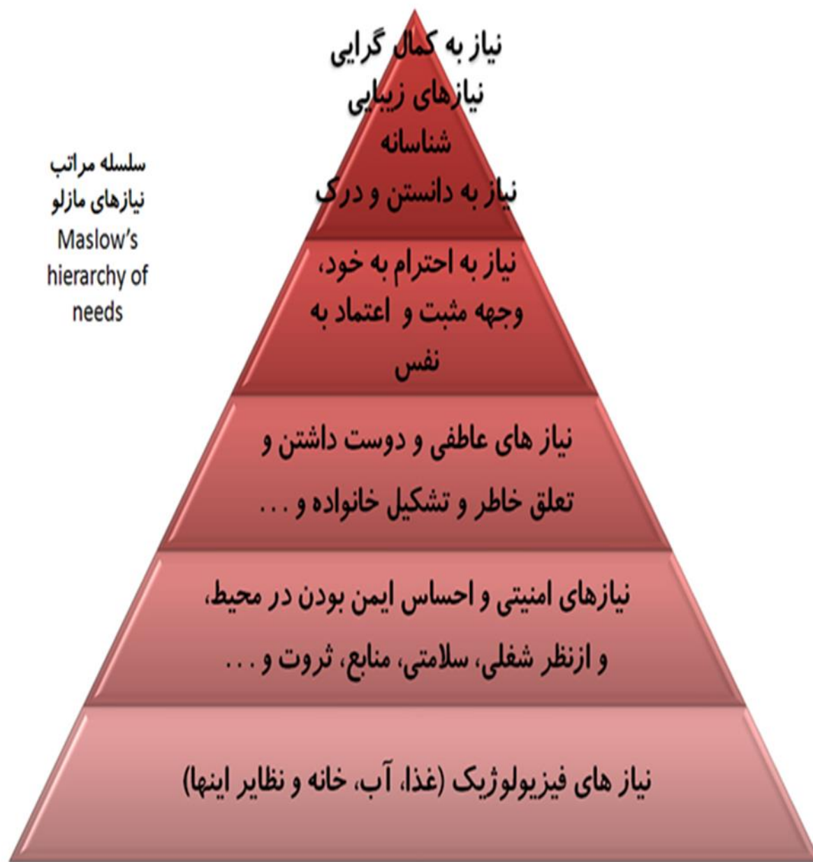
آبراهام مازلو (هرم سلسله مراتب نیاز های )