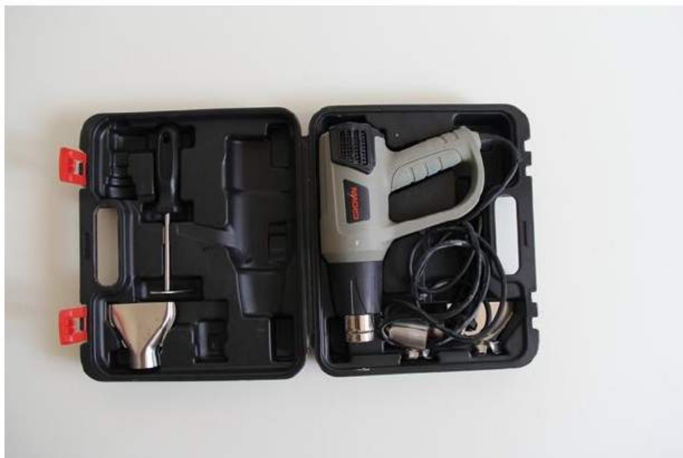
سه شوار صنعتی: کاربرد آن نرم کردن خمیر مجسمه سازی و موم