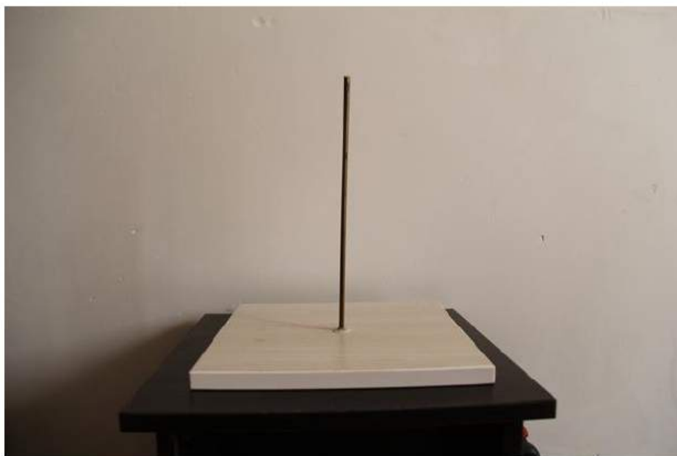
شاسی مجسمه سازی: مناسب جهت ساخت سردیس و نیم تنه .