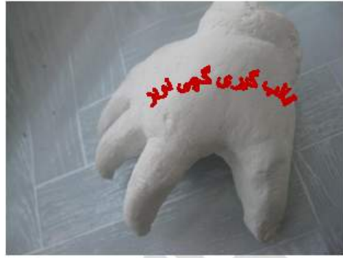
مرحله آخر در صفحه بعدی