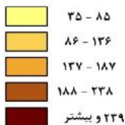
منبع: جدول ۱۰-۶