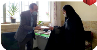
جدول شماره ۲ هیچ برنده ای نداشت!