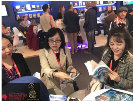
عکس پیوست‌شده به پیام

پاسخ سید احمد الحسن (علیه السلام) به یکی از اشکال‌گیرندگان به انتشار عکس نمایشگاه بین‌المللی کتاب - آلمان.