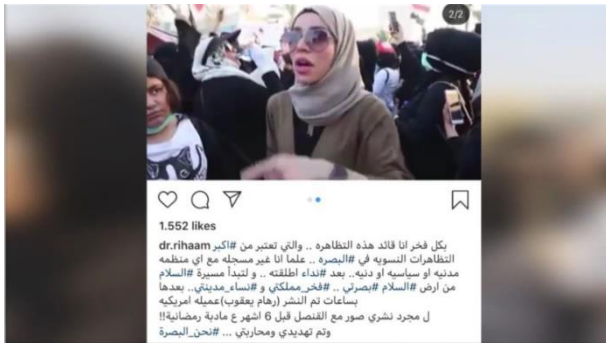
ویدئوی پیوست‌شده به پیام