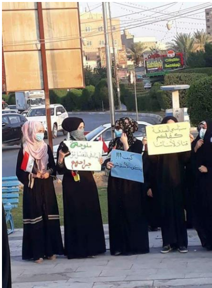
تصویر پیوست‌شده به پیام

۳- تعداد بسیاری از تظاهرکنندگان بصره را بانوان تشکیل دادند و حضور زنان در [تظاهرات] بصره، به زنان دیگر استان‌های عراق شجاعت بخشید تا عنان کار را در دست بگیرند؛ زیرا زن قوی است و می‌تواند کارهای زیادی را تحقق بخشد. تصویر زیر نشان‌دهنده بانوانی است که در تظاهرات اخیر کربلا شرکت کردند.