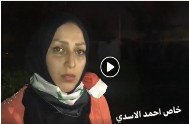
تظاهرات کننده‌ای از بصره

درباره نقش زن در ساختن تاریخ، سید احمدالحسن (عج) فیلمی از یک فعال مدنی منتشر کرده است. ۲