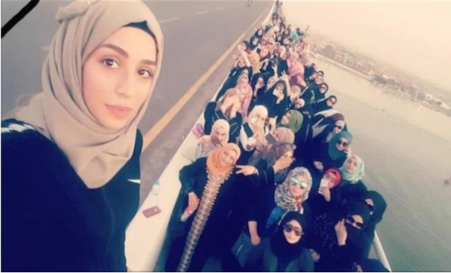
تصویر پیوست‌شده به پیام

سید احمد الحسن علیه السلام در سوگ شهید رهام یعقوب: ۲