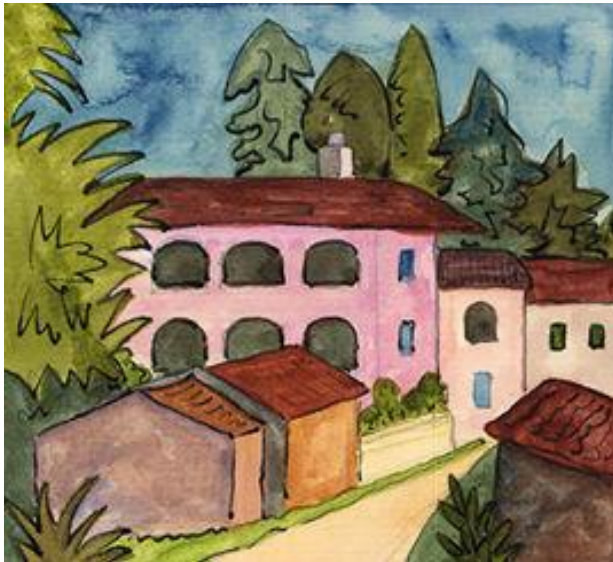
تصویر ۱: هرمان هسه، تابلو مناظر تیسینو (آبرنگ ۱۵*۱۵)، ۱۹۲۰، منبع: museum.oglethorpe.edu

حس مکان چیزی جز تلقی واقیت های مشهود نیست ولی ممکن است تصویر متفاوتی برای هر مخاطب داشته باشد.