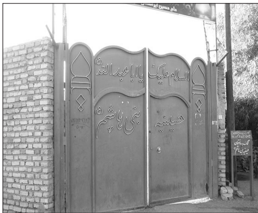
۳. مسجد و-حسینیه-قمر-بنی-هاشم-انتهای-بولوار-دانشجو

برای دو سه هفته اول از مسجدتون عکس داریم! اما از شماره‌های بعد پرکردن این قسمت نشریه به عهده شماست! عکس‌های مسجدتون رو به sangaremahalle@gmail.com بفرستید.