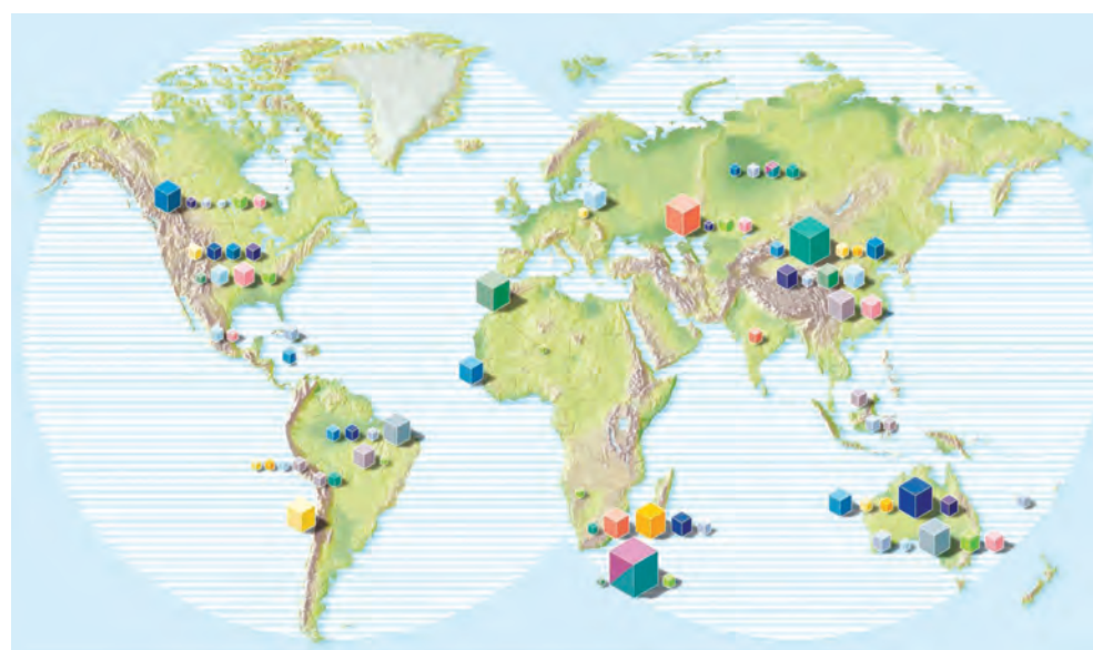
شکل ۲- نمایش توزیع برخی عناصر در جهان. آیا پراکندگی چنین منابعی می تواند دلیلی بر پیدایش تجارت جهانی باشد؟ توضیح دهید. بله

استفاده از آن خانه را گرم یا باک خودرو را پر می کنید، از دل زمین بیرون کشیده اند. با پیشرفت صنعت، شهرها و روستاها گسترش یافتند و سطح رفاه در جامعه بالاتر رفت. با این روند میزان مصرف منابع گوناگون نیز افزایش یافت، به گونه ای که امروزه همه افراد جامعه در پی استفاده از تلفن همراه، خودروی شخصی و انواع وسایل الکترونیکی هستند. تأمین این نیازها به همراه تولید انواع دستگاه ها و ابزارآلات صنعتی، نظامی، کشاورزی و دارویی، سبب شده است تا تقاضای جهانی برای استفاده از هدایای زمینی افزایش یابد، به گونه ای که سالانه حجم انبوهی از منابع شیمیایی بهره برداری می شود. با این توصیف باید باور کنیم که زمین انباری از ذخایر ارزشمند است که بی هیچ منتی به ما هدیه شده است (شکل ۲)، هرچند که این منابع به طور یکسان توزیع نشده اند.