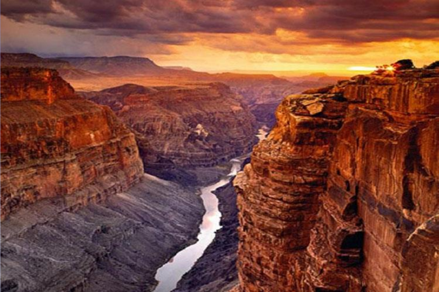
دره‌ی گرند کنیون